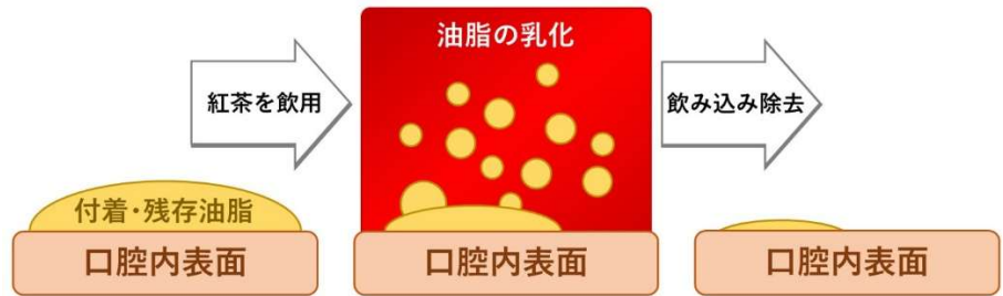
(図2) 紅茶が口腔内油脂を乳化・除去するイメージ