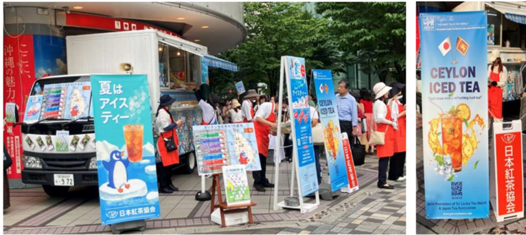
昨年イベントの様子