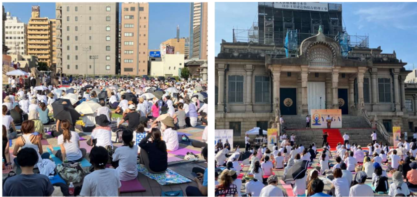
昨年のイベントの様子

【イベント名】 第12回 国際ヨガの日 (International Day of Yoga 2026) (インド大使館主催)